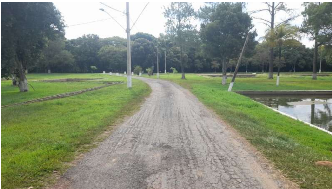
Vias e tanques