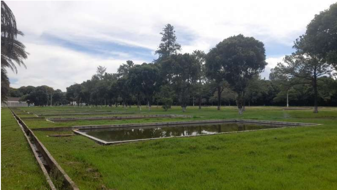
Área dos tanques