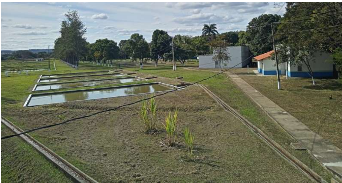
Área dos tanques e prédios