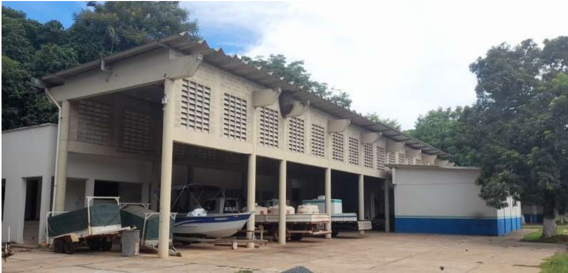
Almoxarifado e garagem