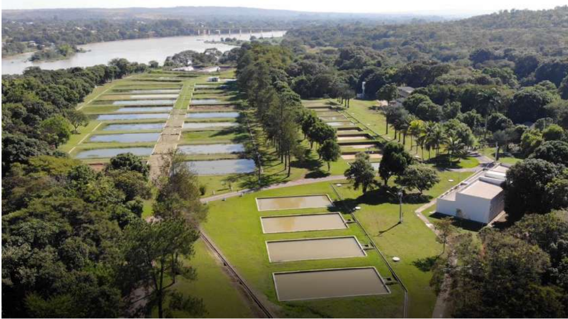
Foto aérea do Centro Integrado de Recursos Pesqueiros e Aquicultura de Três Marias - 1ª/CIM