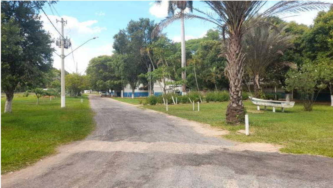
Vias, gramado e prédios