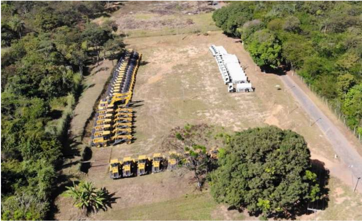
Pátio de bens