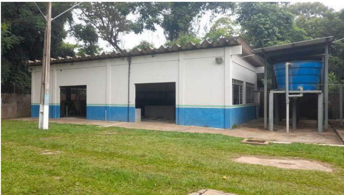
Galpão de reprodução induzida