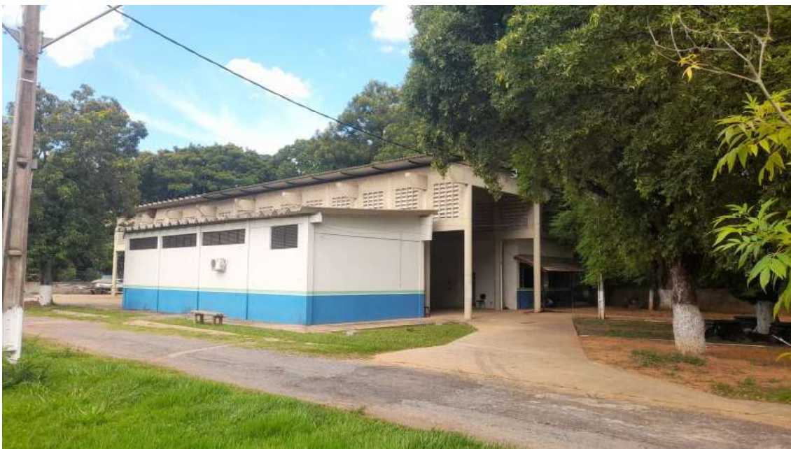
Almoxarifado e garagem