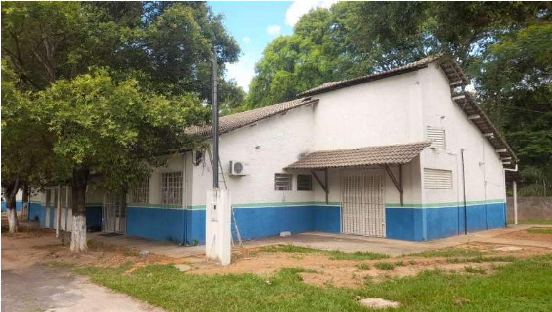
Laboratório – Larvicultura